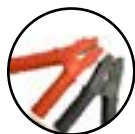
Fonte para bateria