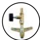
Válvula de Gás